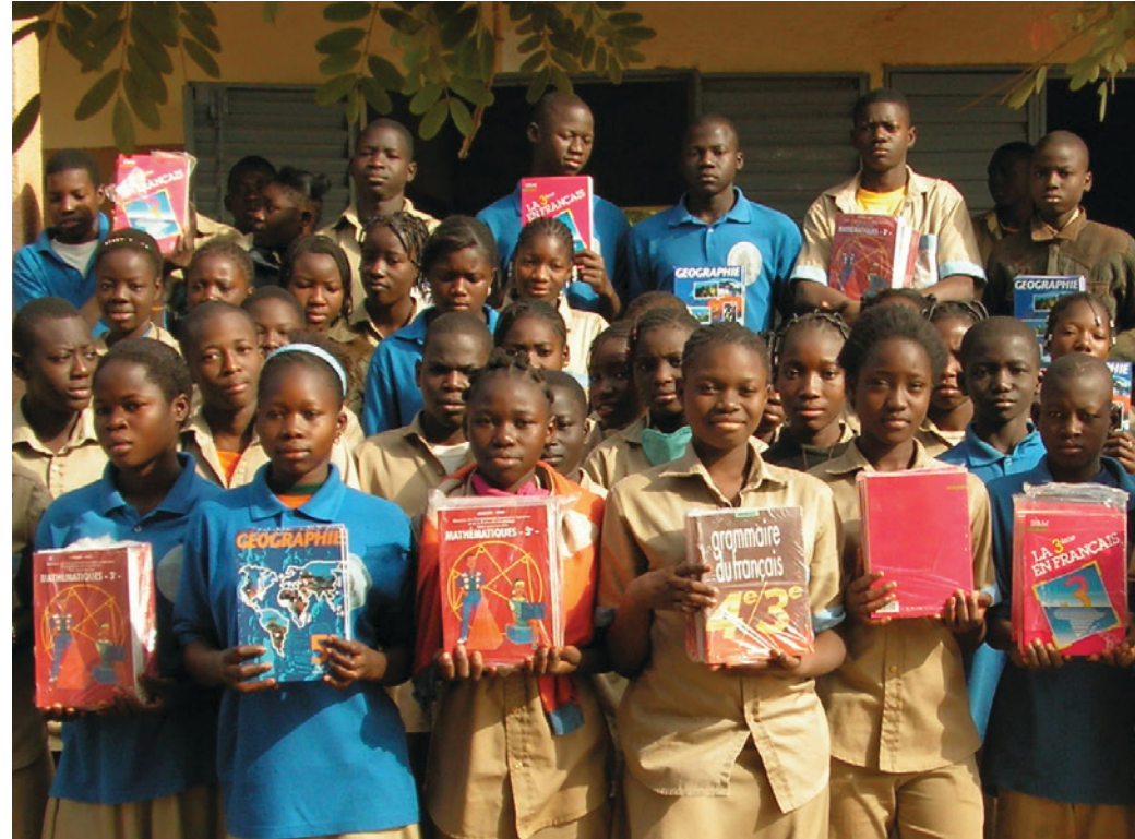
À Ouagadougou, au Burkina Faso, en 2014, les élèves du collège Saaba brandissent les livres financés par l'activité des Papiers de l'espoir. En cette rentrée de septembre 2017, c'est au tour des enfants de la commune de Sapouy de recevoir des ouvrages scolaires.

Professeur d'histoire-géo à la retraite, il est impressionné : « Dans un des collèges visités à Dédougou, à l'ouest du pays, un enseignant donnait un cours d'histoire que je connais bien sur les effets sociaux et économiques de la révolution industrielle du 19 e siècle. Il s'adressait à 40 élèves tous très attentifs pendant deux heures, pourtant sans le moindre support de cours ni manuel auquel se référer. J'aurais bien aimé avoir des enfants aussi concentrés dans mes classes... Au Burkina, les